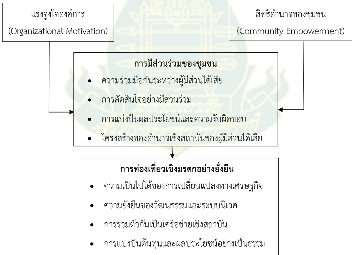
ภาพที่ 2.3 กรอบแนวคิดการมีส่วนร่วมโดยชุมชนสำหรับการท่องเที่ยวเชิงมรดกอย่างยั่งยืน

Li and Hunter (2015) ได้ทบทวนวรรณกรรมและสังเคราะห์กรอบแนวคิดใหม่เกี่ยวกับการมีส่วนร่วมของชุมชนในการจัดการมรดกทางวัฒนธรรมเพื่อการท่องเที่ยวอย่างยั่งยืน และกล่าวว่า มีปัจจัยหลายประการที่เป็นข้อจำกัดของการมีส่วนร่วมโดยชุมชน เช่น ชาวบ้านขาดความรู้ความเข้าใจ ขาดความสนใจ ความมั่นใจ และเวลา อีกทั้งยังทบทวนปัจจัย 2 ปัจจัย ได้แก่ แรงจูงใจองค์การ (Organizational Motivation) และสิทธิอำนาจของชุมชน (Community Empowerment) โดยนำเสนอกรอบแนวคิดซึ่งอ้างถึงว่า แรงจูงใจองค์การและสิทธิอำนาจของชุมชนมีผลต่อการมีส่วนร่วมของชุมชน และจากสองปัจจัยดังกล่าวจะส่งผลต่อการจัดการมรดกทางวัฒนธรรมเพื่อการท่องเที่ยวอย่างยั่งยืน (Sustainable Heritage Tourism) โดยดัดแปลงแนวคิดมาจากตัวแบบบันไดการมีส่วนร่วม (Ladder of Citizen Participation) ของ Arnstein (1969) มาวิเคราะห์ให้เหลือเพียง 4 ขั้นตอน ได้แก่ ความร่วมมือกันระหว่างผู้มีส่วนได้เสีย การตัดสินใจอย่างมีส่วนร่วม การแบ่งปันผลประโยชน์และความรับผิดชอบ และโครงสร้างของอำนาจเชิงสถาบันของผู้มีส่วนได้เสีย โดยปัจจัยที่กล่าวมานี้จะส่งผลต่อแนวคิดของการจัดการการท่องเที่ยวเชิงมรดกอย่างยั่งยืน ได้แก่ ความเป็นไปได้ของการเปลี่ยนแปลงทางเศรษฐกิจ ความยั่งยืนของวัฒนธรรมและระบบนิเวศ การรวมตัวกันเป็นเครือข่ายเชิงสถาบัน และการแบ่งปันต้นทุนและผลประโยชน์อย่างเป็นธรรม ซึ่งแสดงในภาพที่ 2.3