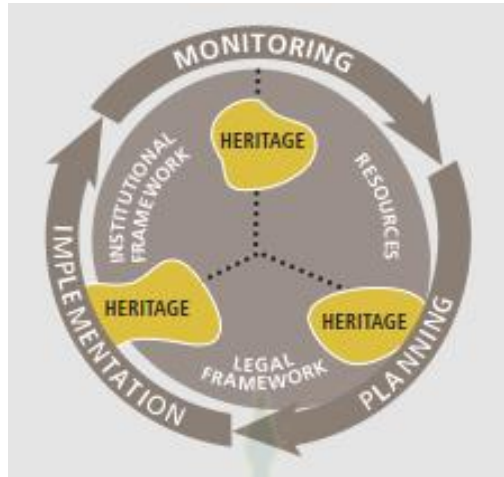
ภาพที่ 2.1 แนวคิดพื้นฐานในระบบการจัดการมรดกวัฒนธรรม